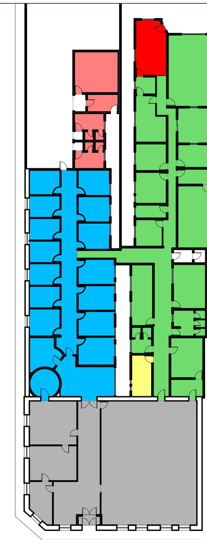
3 PLANTA DE FORRO EXISTENTE ESCALA: 1:50